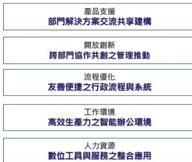
▲ 圖 2 資策會數位轉型一級 ACE 顧問實戰主題成果

招募不同部門顧問分組，運用 STEPS ( Survey ( 需求挖掘 )、Target ( 主題目標 )、Engage ( 鏈結組隊 )、Pilot ( 先導開發 )、Spread ( 服務擴散 )) 方法，從不同場域之數位轉型議題進行實戰演練 ( 如圖 2 )。