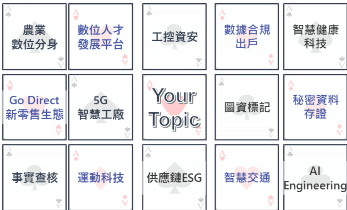
▲ 圖 3 百億數位生態藍圖

透由市場情報、技術主題、環境建構及人才培育等多元功能顧問籌組團隊，運用 SET ( STEPS、Eco-LAB、TEAMS ) 工作坊，從不同產業生態價值體系 ( 如圖 3 ) 作數位轉型實證，採用小組個別 Mentor 輔導機制，結合 STEPS 平台工具，先針對前瞻趨勢進行研究，接著設計生態架構，規劃出特定主題領域數位生態藍圖呈現，並以藍圖為基準模組，推導實證至企業，實踐輔導企業數位轉型，達成轉型改造策略。